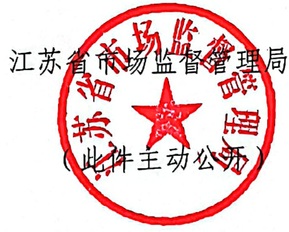
江苏省市场监督管理局