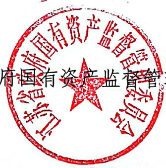
江苏省国有资产监督管理委员会