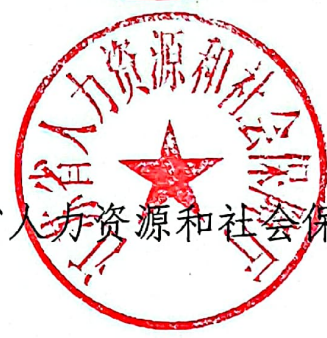
江苏省人力资源和社会保障厅