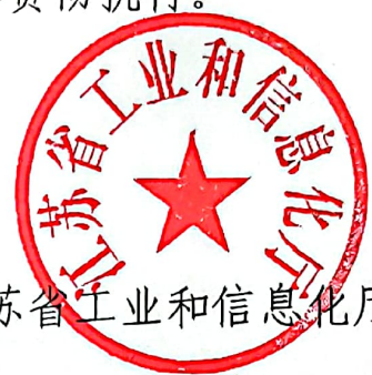
江苏省工业和信息化厅