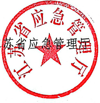
江苏省应急管理厅